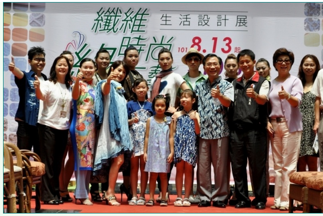
圖說：亞洲大學時尚系為臺中市綠色生活「纖維*時尚*綠工藝生活設計展」進行開幕走秀，活動圓滿成功，獲得滿堂彩。