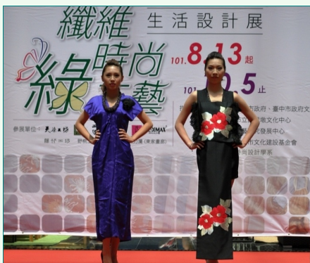
圖說：亞洲大學學生穿著改裝和服上台走秀，在現場引起民眾熱烈討論。