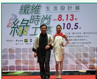
圖說：臺中市副市長蔡炳坤(左)獻出第一次「處女秀」，與亞洲大學學生開場走秀。

「纖維•時尚•綠工藝生活設計展」開幕，亞洲大學時尚系學生穿著改裝和服上台走秀，架勢十足。